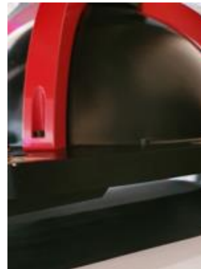
Abb. zeigt Elektrodenprüfung