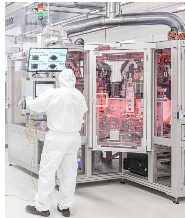
Abb. zeigt Anlage zum Stapeln von Elektroden