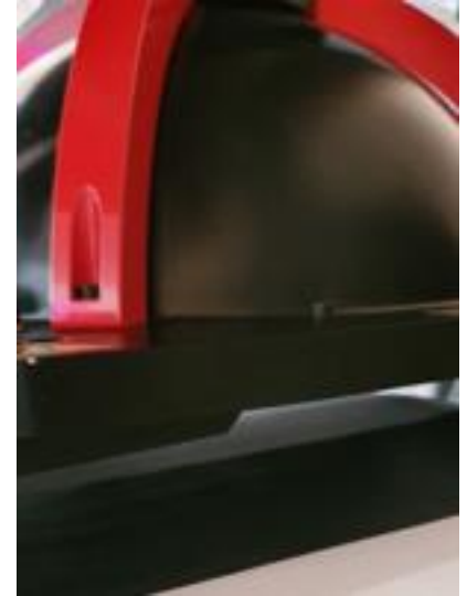
Abb. zeigt Elektrodenprüfung